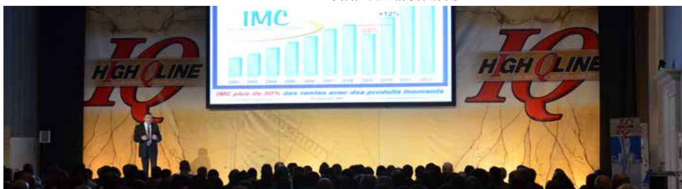
IMC 主要客戶及經銷商活動揭幕

我們期望所有參與 IMC 成員活動的人，無論員工、高級職員或外部顧問，客觀地、真實地、努力為 IMC 成員提供專業服務。出於同樣的原因，我們期望我們的利益相關者積極促使與 IMC 團隊有關的或在經營中可能獲取 IMC 集團資訊的任何其他第三方，觀測並防止任何由於利益衝突導致的內幕交易或不正當活動。